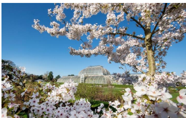
Image 2 Yoshi Cherry Tree at Kew Gardens

18h00 Débarquement au quai de Westminster