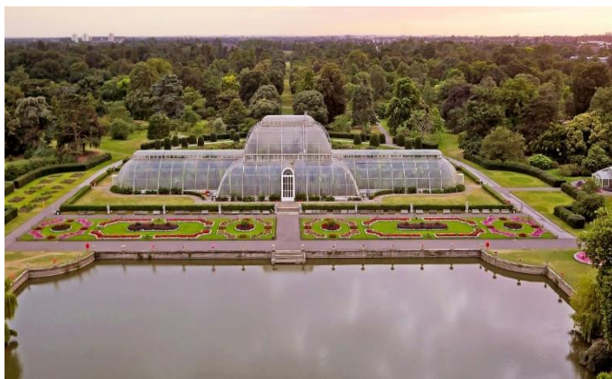
Image 1 Aerial view of Palm House at Kew Gardens

L'excursion aura lieu le vendredi 17 mai . Le bus partira à 9h00 du Centre de l'Aga Khan, Handyside Street. Nous devrions arriver aux Jardins de Kew vers 10h00. À 10h45, une visite guidée est prévue pour présenter les jardins, les points forts et les caractéristiques principales. Pour terminer la journée aux Jardins de Kew, une croisière en bateau sur la Tamise sera réservée de Kew Gardens à Westminster.