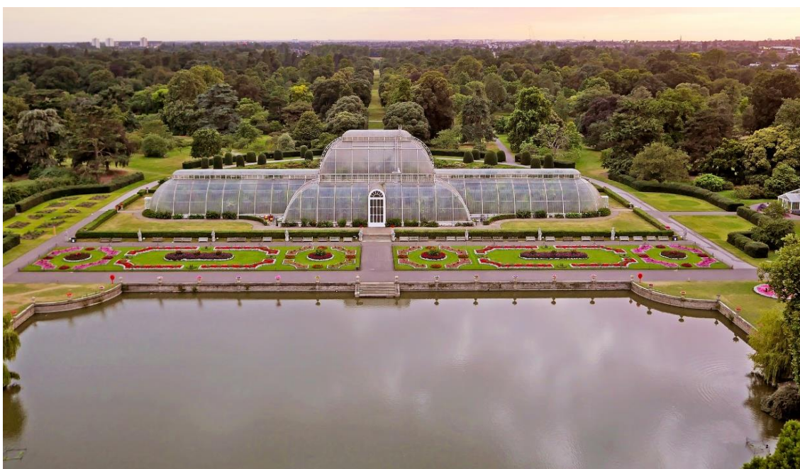
Image 1 Aerial view of Palm House at Kew Gardens

Vendredi 17 mai, il y aura une excursion aux Jardins de Kew à Londres, qui comprendra une visite des jardins et éventuellement une visite de la bibliothèque. L'excursion aux Jardins de Kew se terminera par une croisière en bateau sur la Tamise, de Kew Gardens à Westminster.