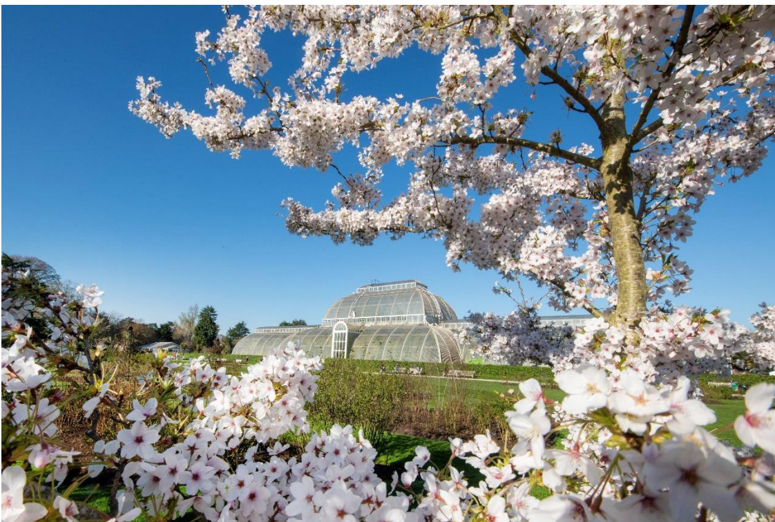
Image 3 Yoshi Cherry Tree at Kew Gardens

Promenez-vous et découvrez une pagode chinoise du 18e siècle de 10 étages, ou un portail japonais parmi les pelouses et les jardins. Ou promenez-vous le long de la passerelle des cimes pour admirer certains des 14 000 arbres et visitez des structures magnifiques comme le Royal Kew Palace et la Palm House - l'une des plus grandes serres victoriennes encore existantes.