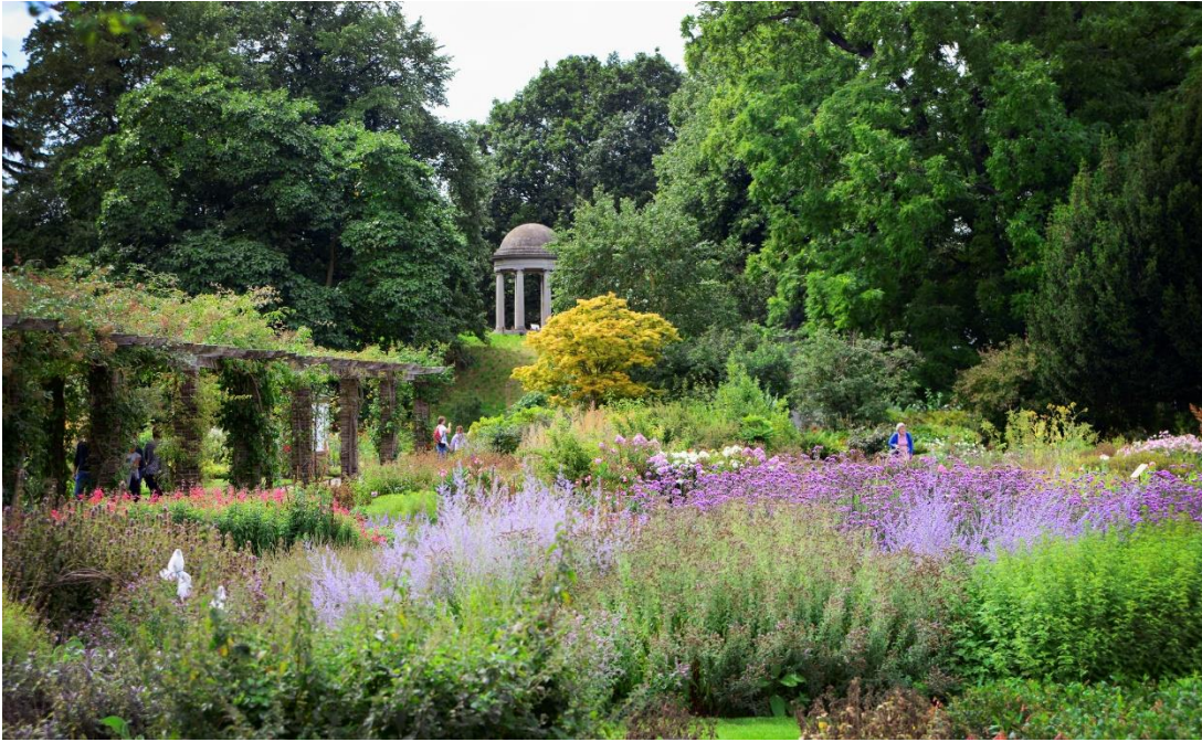
Image 2 Plant family beds in the Walled Herb Garden and the Temple of Aeolus at Kew Gardens / credit RBG Kew.

Promenez-vous et découvrez une pagode chinoise du 18e siècle de 10 étages, ou un portail japonais parmi les pelouses et les jardins. Ou promenez-vous le long de la passerelle des cimes pour admirer certains des 14 000 arbres et visitez des structures magnifiques comme le Royal Kew Palace et la Palm House - l'une des plus grandes serres victoriennes encore existantes.