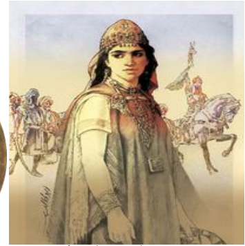
ماسينيسا ديهيا الكاهنة ملكة الأوراس Masinissa DIHIA ELKAHINA PRINCESSE DES AURESS