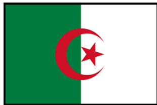
Algeria 562 Titles