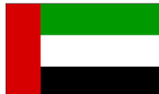
United Arab Emirates 283 Titles