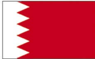
Bahrain 55 Titles