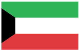
Kuwait 192 Titles