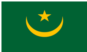
Mauritania 60 Titles