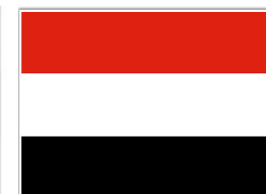
Yemen 104 Titles