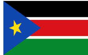
Sudan 95 Titles