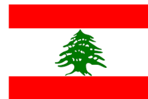
Lebanon 630 Titles