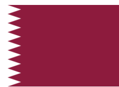
Qatar 51 Titles