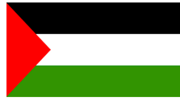
Palestine 150 Titles