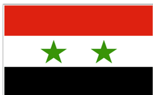
Syria 190 Titles