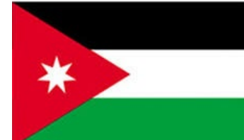
Jordan 230 Titles