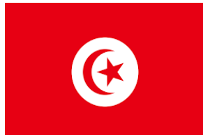
Tunisia 490 Titles