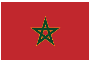
Morocco 460 Titles