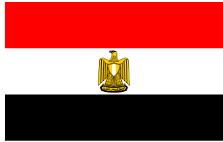
Egypt 3500 Titles