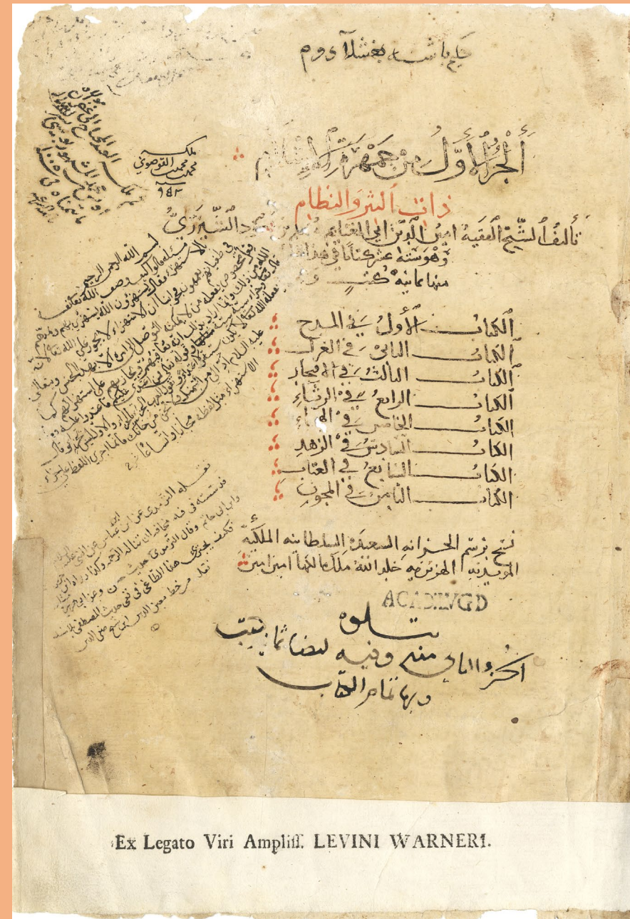
Ex Legato Viri Amplif. LEVINI WARNERI.

Al-Shayzari, Jamharat al-Islam . Dated 697/1298 (Or. 278, Warner collection)